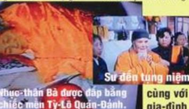
Nhục-thân Bà được đắp bằng chiếc mền Tỳ-Lô Quán-Đảnh.