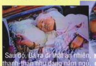
Sau đó, Bà ra đi thật an nhiên, thanh-thản như đang nằm ngủ.

Hỏi Bà sợ chết không? _ "Đã biết vãng-sanh, còn sợ gì!" - như thấy hình ảnh gì