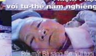
Bà chắp tay niệm Phật với tư thế năm nghiêng

Hỏi Bà sợ chết không? _ "Đã biết vãng-sanh, còn sợ gì!" - như thấy hình ảnh gì