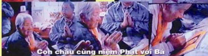
Cộng chúng cùng niệm Phật với Bà