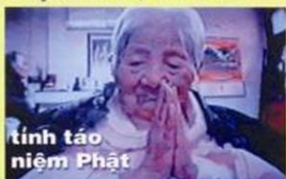
tinh táo niệm Phật