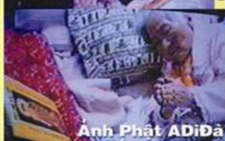
Anh Phật ADiĐà để trước mặt.