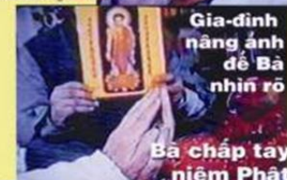
Gia đình nâng ảnh để Bà nhìn rõ